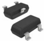
DTC143XEFRATL LAPIS Semiconductor NPN DIGITAL TRANSISTOR (CORRESPO