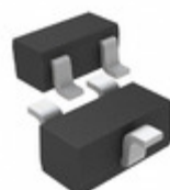
DTC143XETL Rohm Semiconductor TRANS PREBIAS NPN 150MW EMT3