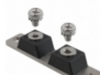
MBR120200CT GeneSiC Semiconductor DIODE SCHOTTKY 200V 60A 2 TOWER