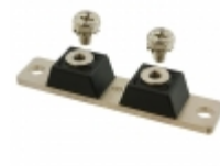
MBR12020CTR GeneSiC Semiconductor DIODE MODULE 20V 120A 2TOWER