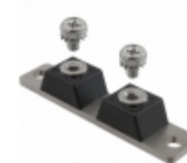
MBR120150CT GeneSiC Semiconductor DIODE SCHOTTKY 150V 60A 2 TOWER