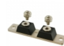
MBR12030CT GeneSiC Semiconductor DIODE MODULE 30V 120A 2TOWER