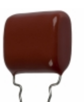
ECQ-P1H274GZW Panasonic Electronic Components CAP FILM 0.27UF 2% 50VDC RADIAL