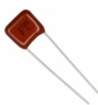
ECQ-P1H273GZ Panasonic Electronic Components CAP FILM 0.027UF 2% 50VDC RADIAL