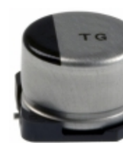
EEV-TG1H330UP Panasonic Electronic Components CAP ALUM 33UF 20% 50V SMD