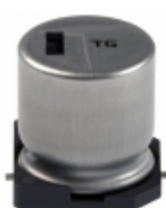
EEV-TG1E471Q Panasonic Electronic Components CAP ALUM 470UF 20% 25V SMD