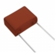
ECW-FA2J334J Panasonic Electronic Components CAP FILM 0.33UF 5% 630VDC RADIAL