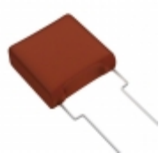
ECW-FA2J274JB Panasonic Electronic Components CAP FILM 0.27UF 5% 630VDC RADIAL