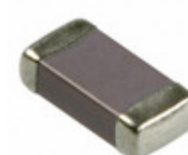
1206YC474KAT4A AVX Corporation CAP CER 0.47UF 16V X7R 1206