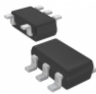
TC1017-2.7VLTTR Microchip Technology IC REG LDO 2.7V 0.15A SC70-5