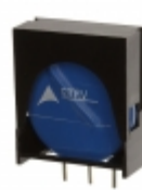
ETFV20K150E2 EPCOS (TDK) VARISTOR 240V 10KA RADIAL