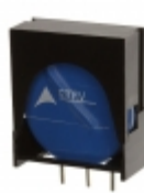
ETFV20K275E2 EPCOS (TDK) VARISTOR 430V 10KA RADIAL