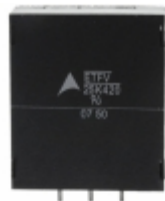
ETFV25K420E4 EPCOS (TDK) VARISTOR 680V 20KA RADIAL