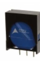
ETFV20K175E2 EPCOS (TDK) VARISTOR 270V 10KA RADIAL