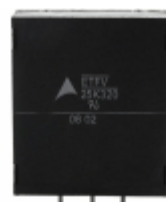
ETFV25K320E4 EPCOS (TDK) VARISTOR 510V 20KA RADIAL