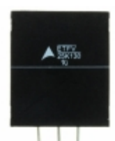
ETFV25K130E4 EPCOS (TDK) VARISTOR 205V 20KA RADIAL