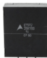
ETFV25K150E4 EPCOS (TDK) VARISTOR 240V 20KA RADIAL