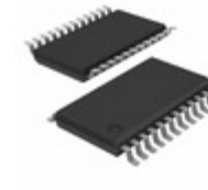
74LCX841MTCX AMI Semiconductor / ON Semiconductor ICLATCH TRANSP 10BIT LV 24TSSOP