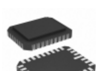
AT28C256E-20LM/883 Microchip Technology IC EEPROM 256KBIT 200NS 32CLCC