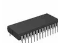
AT28C256E-20DM/883 Micrel / Microchip Technology IC EEPROM 256K PARALLEL 28CDIP