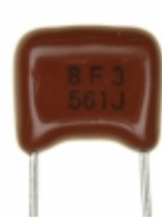
ECQ-B1H561JF3 Panasonic Electronic Components CAP FILM 5600PF 5% 50VDC RADIAL