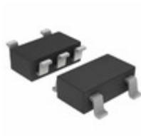
NLV74HC1G14DTT1G ON Semiconductor IC SCHMITT TRIGGER CMOS 5TSOP