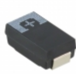
6TPE330MIL Panasonic Electronic Components CAP TANT POLY 330UF 6.3V 2917