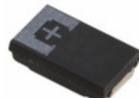
6TPE330MAA Panasonic Electronic Components CAP TANT POLY 330UF 6.3V 2917