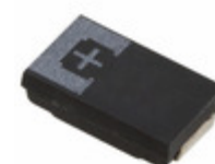
6TPE330MA9EL Panasonic Electronic Components CAP TANT POLY 330UF 6.3V 2917