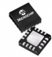
PIC16F506-E/MG Microchip Technology IC MCU 8BIT 1.5KB FLASH 16QFN