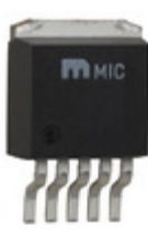
MIC29201-4.8BU Microchip Technology IC REG LDO 4.85V 0.4A TO263-5