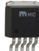
MIC29201-3.3WU Microchip Technology IC REG LDO 3.3V 0.4A TO263-5