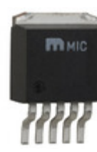
MIC29201-3.3WU-TR Microchip Technology IC REG LDO 3.3V 0.4A TO263-5