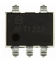
APT1222A Panasonic Electric Works OPTOISOLATOR 5KV TRIAC 6SMD