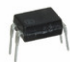
APT1231 Panasonic PHOTOTRIAC COUPLER 600V 4DIP