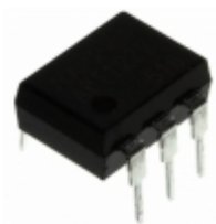
APT1222 Panasonic Electric Works OPTOISOLATOR 5KV TRIAC 6DIP