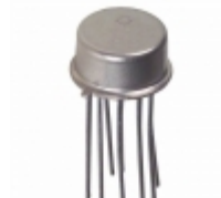
AD532KHZ Analog Devices Inc. IC MULTIPLIER TRIMMED TO- 100-10