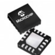
PIC16LF1825T-I/JQ Microchip Technology IC MCU 8BIT 14KB FLASH 16UQFN