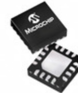
PIC16LF1825-I/JQ Microchip Technology IC MCU 8BIT 14KB FLASH 16UQFN