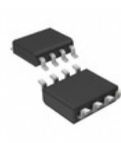
STM795SM6F STMicroelectronics SUPERVISOR 3V SWITCH OVER 8SOIC