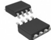
STM795RM6F STMicroelectronics SUPERVISOR 3V SWITCH OVER 8SOIC