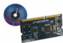
STM8/128-D/RAIS STMicroelectronics BOARD DAUGHTER FOR STM8S207/8