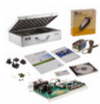
STM8/128-MCKIT STMicroelectronics EVAL KIT MOTOR CONTROL STM8S