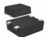
S-1000C17-I4T1U SII Semiconductor Corporation IC VOLT DETECTOR 17V SNT-4A