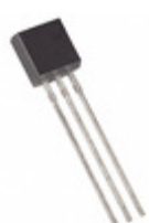
DS1822+PAR Maxim Integrated SENSOR TEMPERATURE 1-WIRE TO92-3