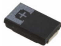
6TPE330MAA Panasonic Electronic Components CAP TANT POLY 330UF 6.3V 2917