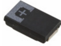
6TPE330MA9EL Panasonic Electronic Components CAP TANT POLY 330UF 6.3V 2917