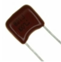
ECQ-B1821JF Panasonic Electronic Components CAP FILM 820PF 5% 100VDC RADIAL