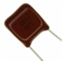
ECQ-B1683JF Panasonic Electronic Components CAP FILM 0.068UF 5% 100VDC RAD