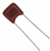
ECQ-B1682JF Panasonic Electronic Components CAP FILM 6800PF 5% 100VDC RADIAL