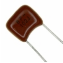
ECQ-B1H102JF Panasonic Electronic Components CAP FILM 1000PF 5% 50VDC RADIAL