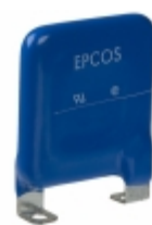
LS40K460QP EPCOS (TDK) VARISTOR 750V 40KA CHASSIS