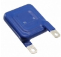
LS40K440QPK2 EPCOS (TDK) VARISTOR 715V 40KA CHASSIS