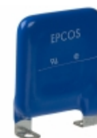
LS40K750QP EPCOS (TDK) VARISTOR 1200V 40KA CHASSIS