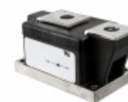
LS410860 Powerex Inc. DIODE MODULE 800V 600A POWRBLOK