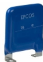
LS40K550QP EPCOS (TDK) VARISTOR 910V 40KA CHASSIS