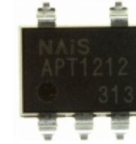
APT1212A Panasonic Electric Works OPTOISOLATOR 5KV TRIAC 6SMD