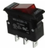
W51-A122B1-10 Agastat Relays / TE Connectivity CIR BRKR THRM 10A 250VAC 50VDC