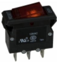
W51-A121B1-20 Agastat Relays / TE Connectivity CIR BRKR THRM 20A 125VAC 50VDC