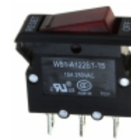
W51-A122B1-15 Agastat Relays / TE Connectivity CIR BRKR THRM 15A 250VAC 50VDC