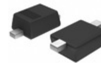
DDZ11CSF-7 Diodes Incorporated DIODE ZENER 11.1V 500MW SOD323F