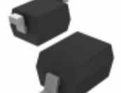
DDZ11CS-7 Diodes Incorporated DIODE ZENER 11.1V 200MW SOD323