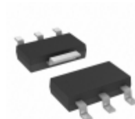
TC1108-2.8VDBTR Microchip Technology IC REG LDO 2.8V 0.3A SOT223-3