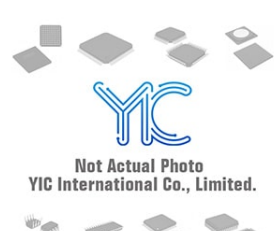
TC1108-3.3VDB Microchip TC1108-3.3VDB Microchip