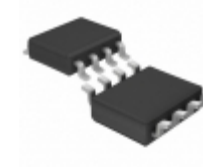
LT1495CS8#TRPBF ADI (Analog Devices, Inc.) IC OPAMP GP 2.7KHZ RRO 8SO