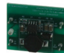
CS5171BSTGEVB AMI Semiconductor / ON Semiconductor EVAL BOARD FOR CS5171BST