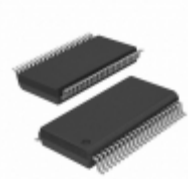
KSZ8721SLA4-TR Microchip Technology IC TXRX ETHERNET 48SSOP