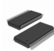
KSZ8721SLA4 Microchip Technology IC TXRX ETHERNET 48SSOP