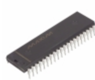
MAX4456CPL+ Maxim Integrated IC VIDEO CROSSPOINT SWITCH 40DIP