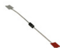
1N4734A-TP Micro Commercial Co DIODE ZENER 5.6V 1W DO41G