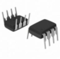
FAN7602BN Fairchild/ON Semiconductor IC PWM FLYBACK ISOLATED CM 8-DIP