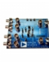
AD8277-EVALZ ADI (Analog Devices, Inc.) EVAL BOARD FOR AD8277