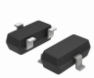
MMBZ5259BLT3G ON Semiconductor DIODE ZENER 39V 225MW SOT23-3