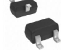
MMBZ5259BT-7-F Diodes Incorporated DIODE ZENER 39V 150MW SOT523