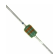
MAZ43300MF Panasonic Electronic Components DIODE ZENER 33V 370MW DO34