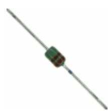
MAZ42200MF Panasonic Electronic Components DIODE ZENER 22V 370MW DO34