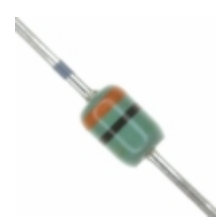
MAZ43000MF Panasonic Electronic Components DIODE ZENER 30V 370MW DO34