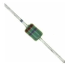
MAZ42700MF Panasonic Electronic Components DIODE ZENER 27V 370MW DO34