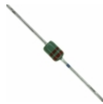
MAZ42200MF Panasonic Electronic Components DIODE ZENER 22V 370MW DO34