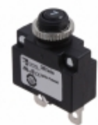
CMB-073-11C1N-B-A/07 Carling Technologies CIR BRKR THRM 7A 250VAC 32VDC