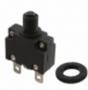
CMB-203-11C3N-B-A Carling Technologies CIR BRKR THRM 20A 250VAC 32VDC