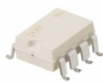
PVI5013RS-T Infineon Technologies OPTOISO 3.75KV 2CH PHVOLT 8-SMT