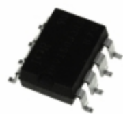
PVI5013RS-TPBF Infineon Technologies OPTOISO 3.75KV 2CH PHVOLT 8-SMT