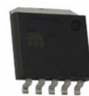
MIC37301-3.3WR Microchip Technology IC REG LDO 3.3V 3A SPAK-5