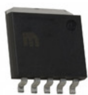
MIC37301-2.5BR TR Microchip Technology IC REG LDO 2.5V 3A SPAK-5