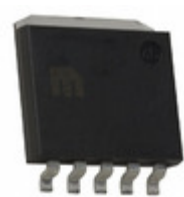
MIC37301-2.5WR-TR Microchip Technology IC REG LDO 2.5V 3A SPAK-5