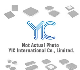
MIC37301-2.5WR TR MICREL MIC37301-2.5WR TR MICREL