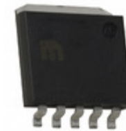
MIC37301-2.5BR Microchip Technology IC REG LDO 2.5V 3A SPAK-5