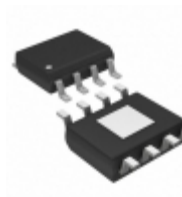
MIC37301-2.5YME Microchip Technology IC REG LDO 2.5V 3A 8SOIC