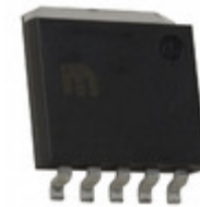
MIC37301-3.3BR Microchip Technology IC REG LDO 3.3V 3A SPAK-5