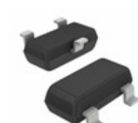
MMBZ18VALFHT116 LAPIS Semiconductor TRANSIENT VOLTAGE SUPPRESSOR (AE)