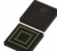
LC4064ZC-37MN56C Lattice Semiconductor Corporation IC CPLD 64MC 3.7NS 56CSBGA