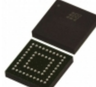
LC4064ZC-5M56I Lattice Semiconductor Corporation IC CPLD 64MC 5NS 56CSBGA