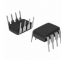
HCPL-4562#020 Broadcom Limited OPTOISO 5KV TRANS W/BASE 8DIP