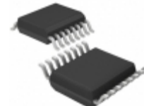
LT1725CGN#PBF Linear Technology IC REG CTRLR FLYBACK 16SSOP