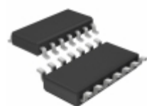
LT1724IS#TRPBF Linear Technology IC OPAMP VFB 200MHZ 14SO