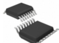
LT1725CGN#TRPBF Linear Technology IC REG CTRLR FLYBACK 16SSOP