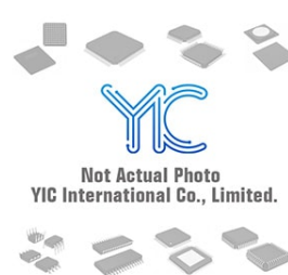
MIC5256-2.85BM5 TR MICREL MIC5256-2.85BM5 TR MICREL