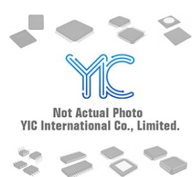
MIC5256-2.85BD5 V V TSOT23-5