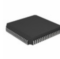
PIC18LF6680-I/L Microchip Technology IC MCU 8BIT 64KB FLASH 68PLCC