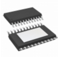
A6276ELPTR Allegro MicroSystems, LLC IC LED DRIVER LIN 75.5MA 24TSSOP