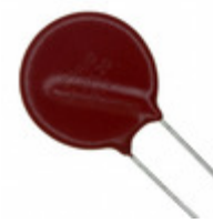
V36ZA80P Littelfuse Inc. VARISTOR 36V 2KA DISC 20MM