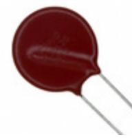
V36ZA80 Littelfuse Inc. VARISTOR 36V 2KA DISC 20MM