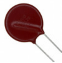
V36ZA80PX1347 Littelfuse Inc. VARISTOR 36V 2KA DISC 20MM