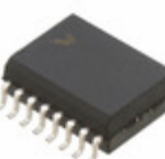
MCHLC705KJ1CDWE NXP USA Inc. IC MCU 8BIT 1.2KB OTP 16SOIC