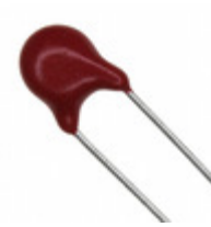
V39ZS05 Littelfuse Inc. VARISTOR 39V 100A DISC 5MM