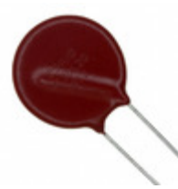
V39ZS20PX2855 Littelfuse Inc. VARISTOR 39V 2KA DISC 20MM